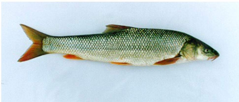
شکل ۴: گونه ( Luciobarbus capito (Güldenstaedt, 1773)

۶۵-۵۷ \text{ L.L} \quad ۶/A \text{ II-III} \quad ۸/D \text{ IV}