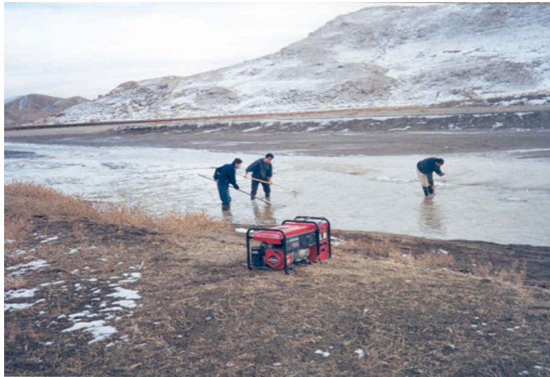
شکل ۱: نمونه برداری از ماهیان با دستگاه الکتروشوکر.

در شکل ۱، نمونه برداری از ماهیان با استفاده از دستگاه الکتروشوکر نشان داده شده است.