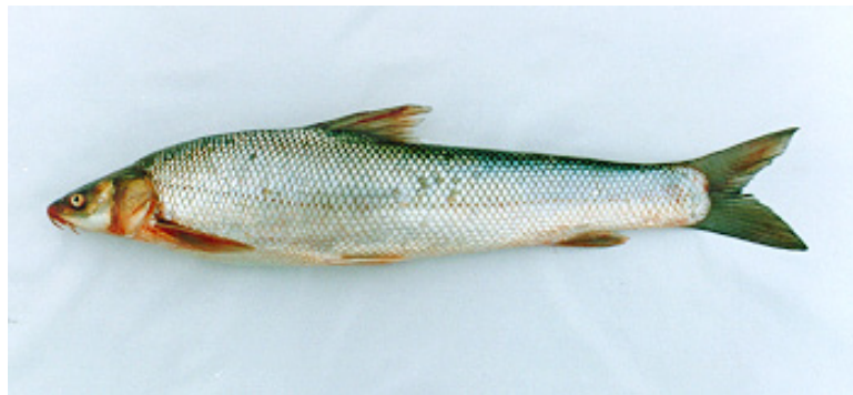
شکل ۳: سس ماهی گونه ( Luciobarbus brachycephalus (Kessler, 1872)

۷۵-۶۷ \text{ L.L} \quad ۷/D \text{ IV} \quad ۶/A \text{ II}