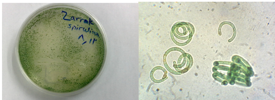
شکل ۴- اسپیرولینا در محیط کشت زاروک

طی دوره های مختلف جلبک زیر میکروسکوپ بررسی شد و حالت پلی مورفیسم به وضوح در آن قابل مشاهده بود که دلیل آن تغییرات فیزیکی (مثل دما، نور و غلظت محیط کشت) در محیط کشت می باشد. نتایج شمارش جلبکی در جدول ۴ و ۵ و میزان رشد و تکثیر در جدول ۶ آورده شده است. در جداول دوره منظور زمانی است که اسپیرولینا حداکثر رشد را داشته و پس از آن برداشت شده است.